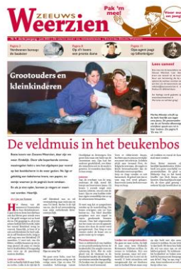
Nr 9: Grootouders en kleinkinderen

In 2021 is Zeeuws Weerzien driemaal verschenen: in juni, september en december (nrs 9, 10 en 11). De geplande maart-editie kon niet worden uitgegeven in verband met de beperkingen van coronamaatregelen. Veel afzetpunten waren gesloten. Ook de veiligheid van onze vrijwilligers én lezers wilden wij niet in gevaar brengen.