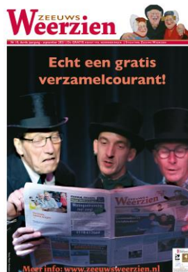
Nr 10: Verzamelen