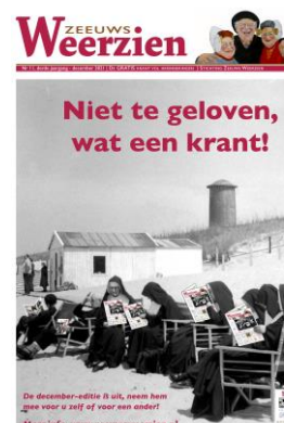
Nr 11: Geloof en ongelooft

Onze digitale nieuwsbrief is in 2021 vier maal verschenen. Niet alleen werden hierin de nieuwe edities van Zeeuws Weerzien aangekondigd, ook hebben wij informatie gegeven over diverse onderwerpen waaronder nieuwe afhaalpunten, de oproep om mee te doen met de leesestafette en de uitslag van de prijspuzzel. Lezers worden gestimuleerd te reageren op een preview van een artikel uit de krant, door eigen herinneringen in te sturen. Het aantal abonnees is gegroeid van 1068 (december 2020) naar 1275 (december 2021). Monitoring leert dat gemiddeld 70 tot 75% van de ontvangers de nieuwsbrief open klikt, ruim 20 % klikt op verwijzingen in de tekst naar onze website.