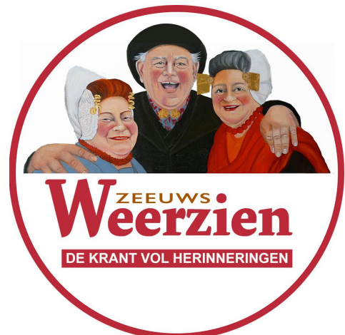
Het nieuwe beeldmerk is ter beschikking gesteld door DOEKENVANYAN

Op de voorpagina is een nieuw beeldmerk geplaatst, dat beter past bij de doelstelling en aard van de krant. Drie figuren in streekdracht kijken de lezer vrolijk aan, waardoor de aandacht op actieve en positieve wijze op de krant wordt