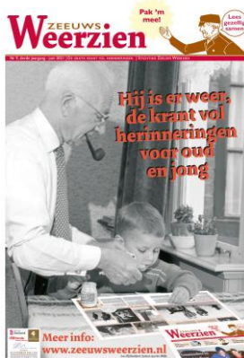
Nr 9: Grootouders en kleinkinderen

Iedere nieuwe editie van de krant is vergezeld van een persbericht en aankondigingsposter , waarop tevens de subsidiegevers en sponsors zijn vermeld. De poster wordt meegeleverd met de kranten, zodat deze op alle distributiepunten kan worden opgehangen.