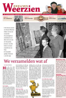
Nr 10: Verzamelen