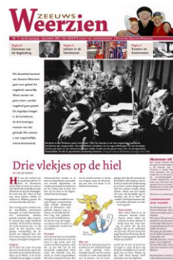
Nr 11: Geloof en ongelooft